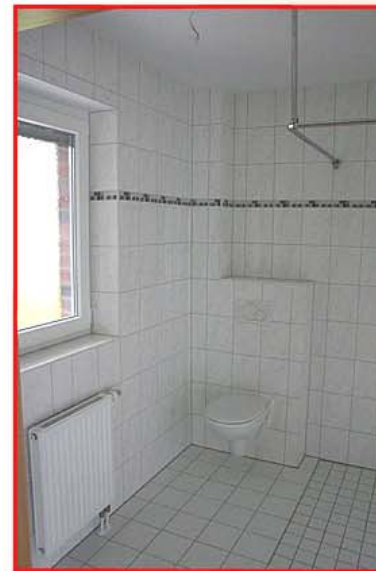
Bad mit bodengleicher Dusche (1,20 m x 1,20 m)

Standardmäßig gehört zu jeder Wohnung eine Fahrradbox, in der die Bewohner ihre Räder, Rollatoren etc. unterbringen können